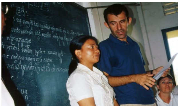
DED-Kambodscha 2002

Die Zusammenarbeit wird basisnah und nachfrageorientiert mit Freiräumen für Innovation und Kreativität organisiert, die gemeinsame Problemlösungen unter Partnern erlauben. So verbindet das Programm fachliche Kompetenz mit solidarischem Handeln. Der aktuellen Ökonomisierung aller Lebensbereiche wirkt es entgegen. Ganzheitliches langfristiges Denken statt kurzfristiges Gewinnstreben und Eigennutz leiten uns.