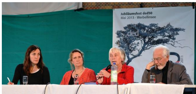
Podiumsdiskussion Werbellinsee 2013

Wichtig für uns: wir sind Mitglied von VENRO e.V..