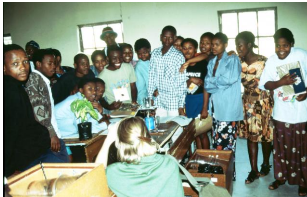
DED S-Afrika 1999

Einig sind wir hier mit Entwicklungsminister Dr. Gerd Müller, wenn er in seinen Reden die Werteorientierung der Entwicklungspolitik betont und unsere ethisch-moralische Verpflichtung, Verantwortung für Frieden und Gerechtigkeit in der Welt zu übernehmen.