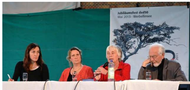
Podiumsdiskussion am Werbellinsee 2013 mit Erhard Eppler

Der DED-Freundeskreis ist Mitglied des zivilgesellschaftlichen Dachverbandes VENRO e.V..