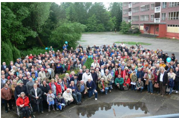
Werbelliner Treffen 2013

Dabei wurde erstmals in einem größeren Rahmen und nach vorne schauend die Idee diskutiert, ein internationales Austauschprogramm für engagierte Fachkräfte ins Leben zu rufen.