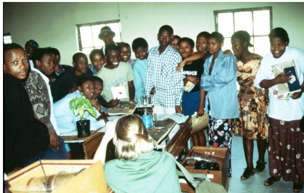
DED unterstütztes Gesundheitsprojekt in Süd--Afrika 1999

Einig sind wir hier mit Entwicklungsminister Dr. Gerd Müller, wenn er in seinen Reden die Werteorientierung der Entwicklungspolitik betont und unsere ethisch-moralische Verpflichtung, Verantwortung für Frieden und Gerechtigkeit in der Welt zu übernehmen.