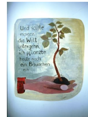
EH Wandmalereien aus Wohnbereich DED Kladow 2001. W Würtele