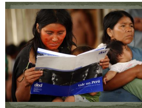
DED-Peru 2006

Die Weltgesellschaft ist mit vielfältigen, zum Teil sich verschärfenden Krisen konfrontiert. Wachsende soziale Ungleichheiten, grenzenloser Raubbau an den natürlichen Ressourcen und massive Klimaveränderungen gefährden die Überlebenschancen zukünftiger Generationen. Grundlegende Menschenrechte werden Milliarden von Weltbürgerinnen und Weltbürgern vorenthalten; Kriege und Flüchtlingsdramen nehmen erschreckende Ausmaße an.